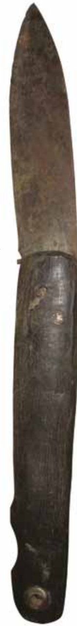
Kılıçtan bıçağa uzanan bir serttven...