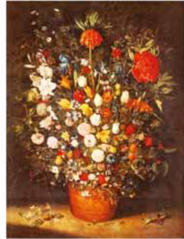
Jan Brueghel (1568 - 1625)