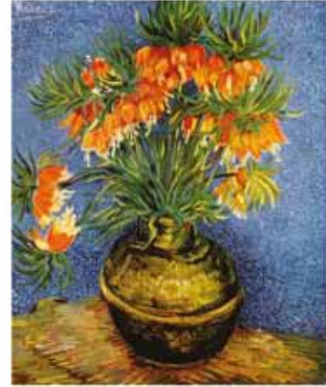
Van Gogh (1853-1890)

"Lale der ki: Ey Allah'ım benim boynum neden eğri? Yardan ayrı düştüm gayrı, benden ala çiçek var mı?"