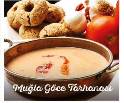
Muğla Göce Tarhanası