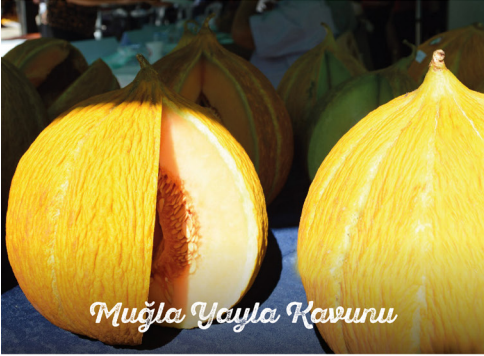
Muğla Yayla Kavunu