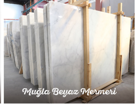
Muğla Beyaz Mermeri